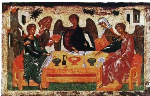
Троица. 14 в. Псков (Авраам и Сарра служат)